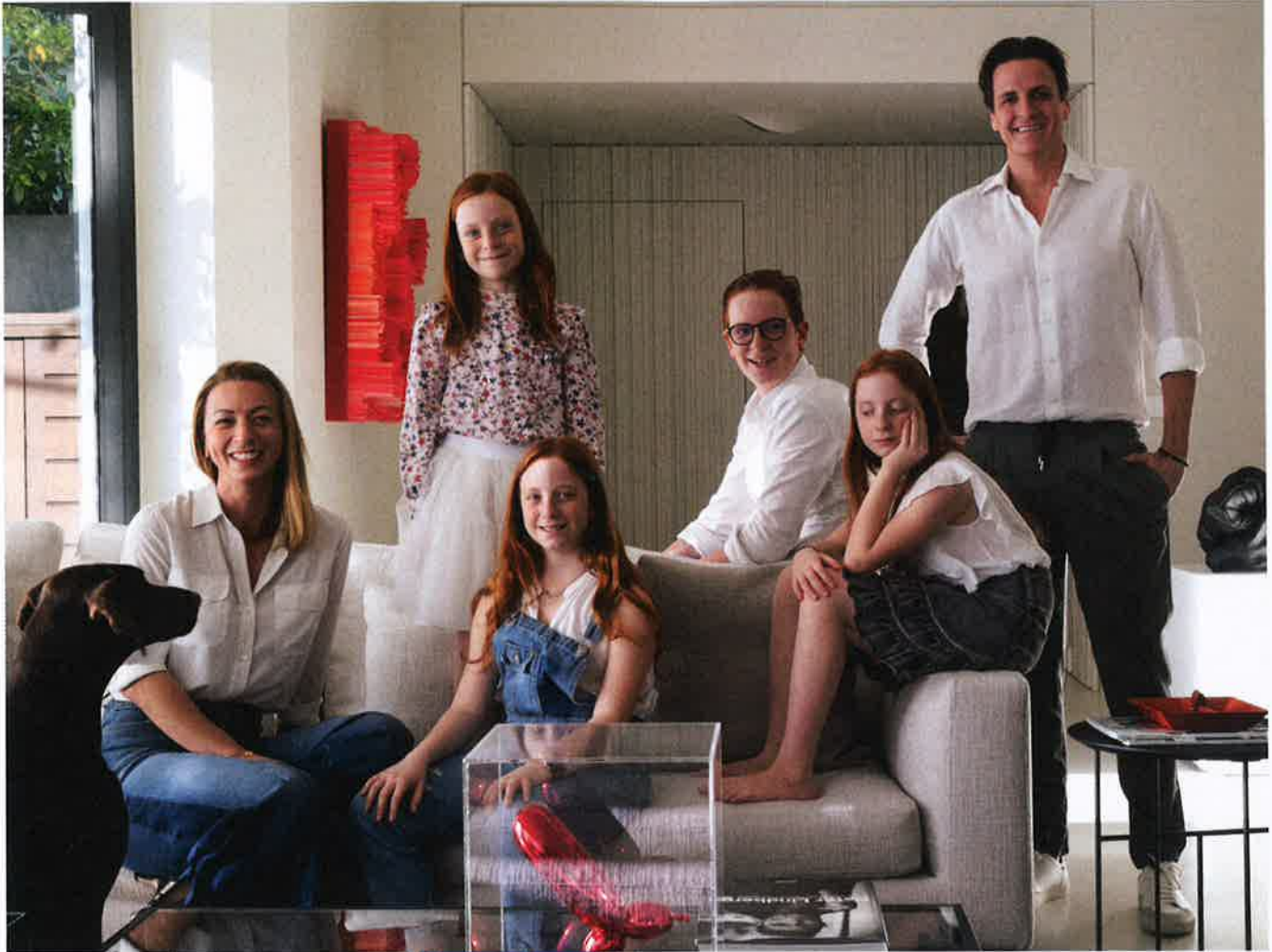
CAMERA DA LETTO PADRONALE: LETTO FEBO DI MAXALTO CON CUSCINI DI L'OPIFICIO. TAVOLINO TULIP DI KNOLL IN MARMO, LAMPADA DI LOUIS POULSEN, OPERA DI MARCELLO LO GIUDICE. IN ALTO, RITRATTO DI FAMIGLIA AL COMPLETO.